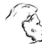
Odcep E7 Pot Mare Rupene